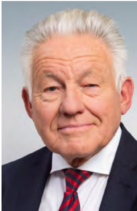
LH a.D. Dr. Josef Pühringer Landesobmann

Die neue Sozial-Info 2025 soll als Sozialratgeber dienen und einen kompakten Überblick über verschiedene Sozialleistungen und Beratungsstellen bieten.