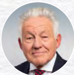
Landesobmann LH a. D. Dr. Josef Pühringer